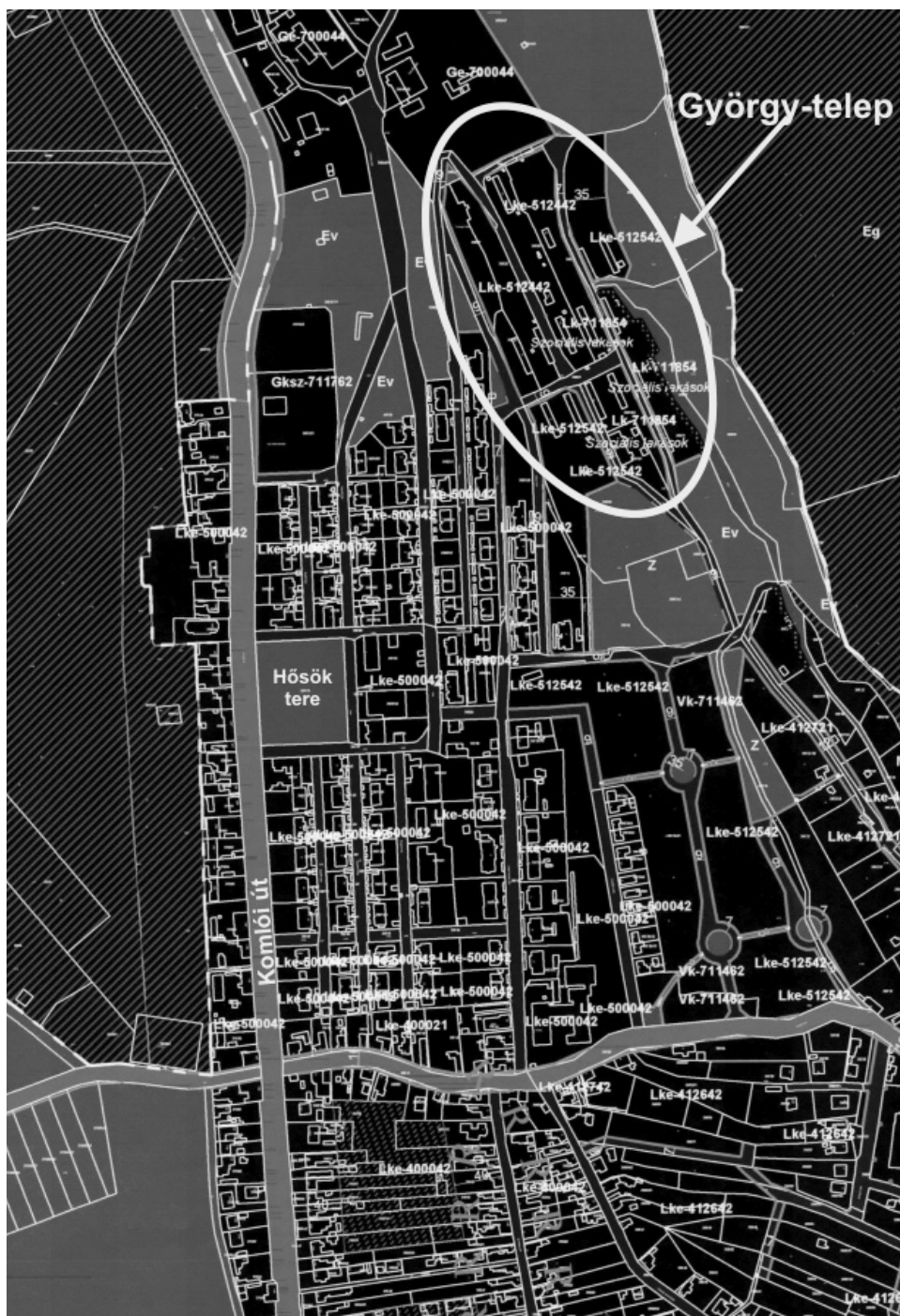
2. térkép: György-telep a Keleti városrészben belül