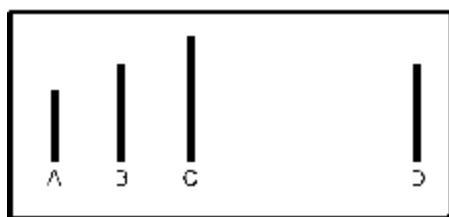
18.1 ábra Az Asch-féle kísérlet: különböző hosszúságú vonalak

A feladat, gondolom, elég egyszerűnek tűnik: nyilván "B" a helyes válasz. Dolgunkat az nehezíti egy kissé, hogy mindazok, akik velünk együtt a szobában ülnek, azt állítják, hogy az A vonal a D-vel egyező hosszúságú! Valójában persze a többi résztvevő a kutató